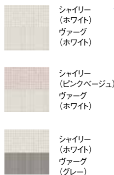
シャイリー (ホワイト) ヴァーグ (ホワイト) シャイリー (ピンクベージュ) ヴァーグ (ホワイト) シャイリー (ホワイト) ヴァーグ (グレー)